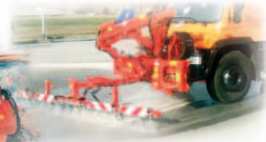
HÖGTRYCKS SPOLARE 1,8 TILL UNA ARM