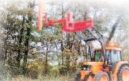
GRENSAXS AWS 22