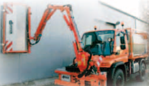
TUNNEL TVÄTT ANLÄGGNING ARBETSBREDD 1,8 M