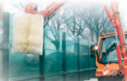
SKYLTTVÄTT ANLÄGGNING. RENGÖR SKYLtar OCH LJUD/AVGRÄNSNINGSVÄGGAR