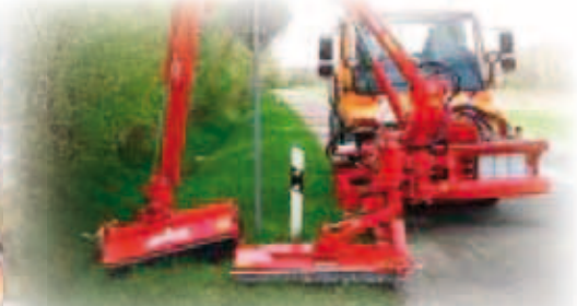
TANDEMKLIPPARE MK 25 BESTÅENDE UTAV VÄG- KANTKLIPPARE RSM 13 OCH MK 12 PÅ DUA 800