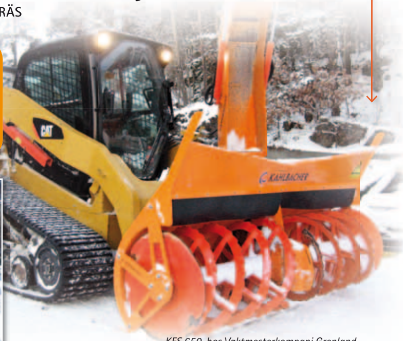
KFS 650, hos Vaktmesterkompani Grenland.