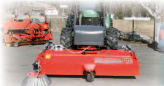
SOPMASKIN FKM – VÅR STOR SÄLJARE SOP MASKIN I HÖG KVALITET